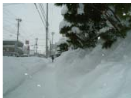
夏 季 富田通り（正門付近から南方面を撮影） 冬 季